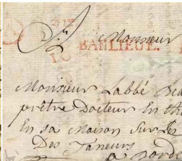
Lettre d'Arveyres (circuit de l'Entre-Deux-Mers) du 9 avril 1769 en port dû pour Bordeaux. Bureau A, quantièrme 10, 2 ème levée, marque banlieue vue la provenance. Boîtier A 31 au tampon de Vayres où la lettre a été remise. Taxe 3 sols des lettres de banlieue pour Bordeaux.