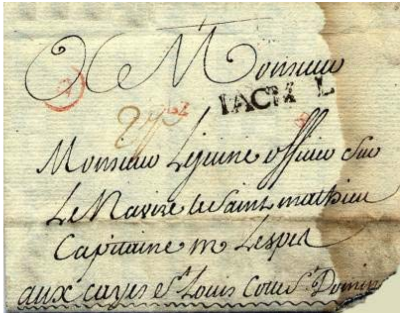
Lettre en port payé du 10 juillet 1771 de Bordeaux pour Les Cayes (Saint-Domingue). Bureau B, 7 ème levée. Cette lettre a payé 2 sols pour être remise au capitaine du navire. À l'arrivée, marque JACMEL et taxe 2 escalins correspondant au port entre Jacmel et Les Cayes.

Contrairement à la moyenne des lettres d'Ancien Régime, les lettres de Petite Poste sont particulièrement riches en marques diverses et novatrices. Les lettres en port dû, signalées par le mot «DU», sont les plus habituelles. Cette marque s'associe à celle du bureau A ou B, à un timbre de quantième et à un timbre de levée. Les lettres en port payé marquées « Pt Payé » sont peu fréquentes comme les marques de boîtiers. Les lettres provenant de banlieue portent un timbre BANLIEUE. Comme la Petite Poste se chargeait des lettres de ou pour les colonies, certaines lettres avec marques de Petite Poste de Bordeaux viennent ou sont adressées outre-mer. Plus tardivement apparaissent, vers 1796, les marques Petite Poste de Bordeaux. La linéaire est connue jusqu'en 1822, elle est plus rare en PP et encore plus rare dans un octogone orné de guirlandes.