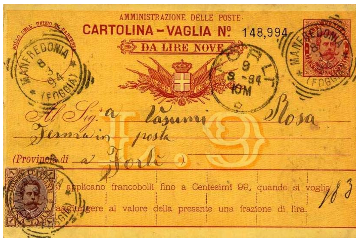
Figure 1 : cartoline vaglia de 9 liras du 8 mars 1894 envoyée de Manfredonia avec ajout d'un timbre-poste à 1 lire de type Umberto I (excès de 1 c toléré) encaissée à Forli le 9 mars.

Ce premier modèle à valeur fixe permettait à l'expéditeur d'augmenter la valeur de la carte en ajoutant des centesimi (maximum autorisé : 99). Cet ajout était matérialisé par l'apposition de timbres-poste à valeur purement monétaire. La poste tolérait parfois un faible dépassement (fig. 1).