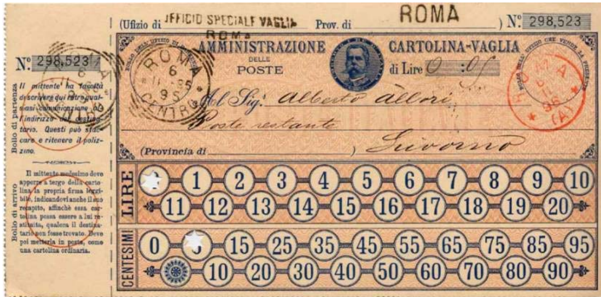
Figure 2 : cartoline vaglia de 5 centesimi du 6 novembre 1896 de Rome pour Livourne. Modèle expérimental utilisé dans quelques localités importantes.

Le deuxième modèle, émis le 25 janvier 1896, se présentait sous la forme d'une carte unique permettant tout transfert d'argent de 5 centesimi à 20,95 lires (et non plus à 20,99). Il suffisait, au moment de l'achat dans un bureau de poste, de faire perforer avec un poinçon en étoile (ou rond) les chiffres correspondant à la somme à envoyer (fig. 2).