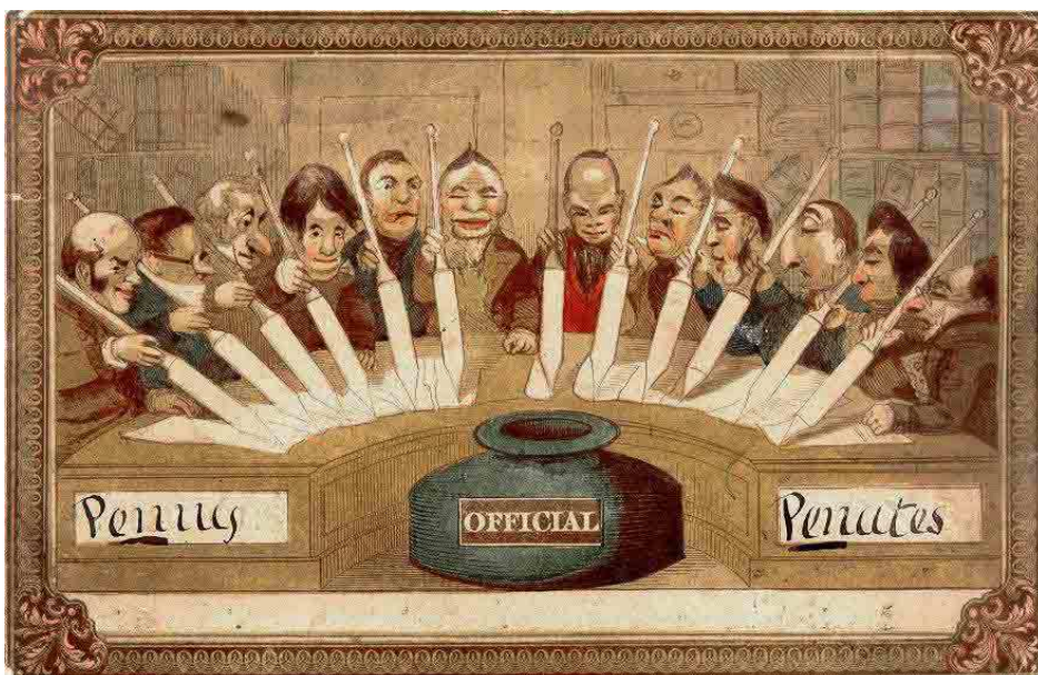
Fig. 1. Carte dessinée par Theodore Hook, envoyée localement à Londres, 14 juillet 1840. Affranchissement (au recto) 1 penny. Collection Eugene Gomberg.