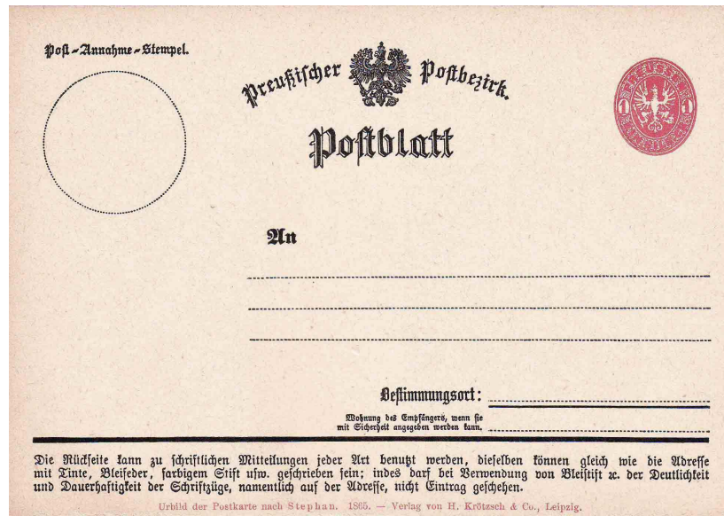
Figure 2. Reconstitution par Kalckhoff (1911) de la carte postale « Postblatt » proposée par Von Stephan en 1865.

Le premier projet pour la carte postale telle que nous la connaissons aujourd'hui, a été proposé par Heinrich Von Stephan en 1865, pendant la 5e conférence de l'Union postale allemande. La reconstitution de Kalckhoff de 1911 (fig. 2) montre un entier postal de Prusse, affranchi à 1 silbergroschen. L'adresse figure au recto, tandis que le verso est réservé pour la correspondance.