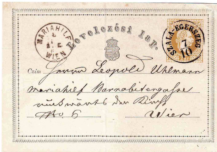
Figure 4. 7 octobre 1869. 1 ère carte postale de Hongrie (blason et texte hongrois), envoyée de Szala-Egerszeg à Vienne et arrivée le 8 octobre.

La poste autrichienne fait preuve d'une grande réactivité en mettant rapidement en œuvre cette proposition. Le 1er octobre 1869 apparaissent les trois premières cartes postales officielles, simultanément en Autriche et en Hongrie (en hongrois et en allemand). Ces cartes postales (fig. 4) sont des entiers postaux de petite taille (12,2 x 8,3 cm) avec une valeur faciale de 2 kreuzers. La poste autrichienne a retenu la proposition d'un tarif allégé à 2 kreuzers, sans pour autant limiter le nombre de mots. Cette première carte a tout de suite connu un immense succès.