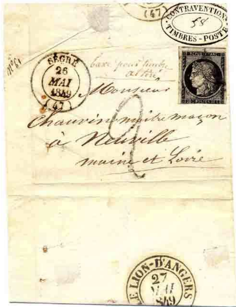
Figure 2. Lettre de Segré (Maine-et-Loire) du 25 mai 1849 adressée à Neuville (Maine-et-Loire) dépendant postalement du bureau de Le Lion d'Angers. Affranchissement avec un 20 c noir Cérés ayant déjà servi. Taxation à 20 c (taxe 2 tampon) comme lettre non affranchie jusqu'à 7,5 g selon le tarif du 1er janvier 1849 justifiée par la mention manuscrite «Taxe pour timbre altéré ». Timbre à date au type 14 de Segré du 25 mai 1849. Le bureau des contraventions a apposé au verso son timbre ovale « CONTRAVENTION TIMBRES POSTES » complété par le numéro 58.

Avec la circulaire du 10 mai 1849, c'est un ensemble de procédures qui sont mises en place dans un souci d'une répression encore plus importante. En effet, même dans le cas de timbres ayant déjà servi, un procès-verbal est établi. Un dossier de saisie du 26 mai 1849 portant le n° 58 illustre cette période (fig. 2). À cette date, le procès-verbal n° 1078 ainsi qu'un imprimé spécifique pour envoi du dossier de saisie au procureur de la République sont déjà créés.