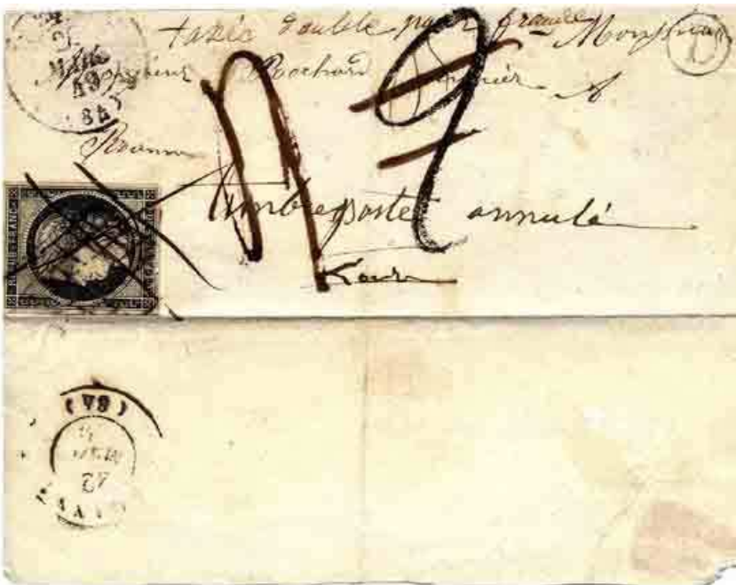
Figure 1. Lettre extraite de la boîte rurale D de Saint-Étienne (Loire) pour Roanne (Loire) du 20 mars 1849. Affranchissement avec un 20 c noir Cérès ayant déjà servi. Taxation à 4 décimes (taxe manuscrite 4), taxe double en vertu de l'article 98 du 17 janvier 1849. Le tarif de lettre non affranchie jusqu'à 7,5 g selon le tarif du 1er janvier 1849 est de 20 c, la taxe double est donc de 40 c soit 4 décimes. Deux mentions manuscrites sont présentes : « Taxée double pour

Ainsi, dans la période comprise entre le 1er janvier et le 16 janvier 1849, une lettre revêtue d'un timbre ayant déjà servi ou contrefait sera taxée comme une lettre non affranchie, avec simplement une mention manuscrite « taxe pour timbre annulé ». La répression est plus importante dans la période du 17 janvier au 9 mai 1849 : une taxe double de la lettre non affranchie est appliquée avec la mention manuscrite « taxée double pour fraude » (fig. 1). En outre, un procès-verbal est établi pour les lettres revêtues de timbres contrefaits.