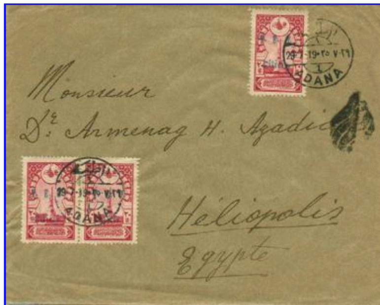
Lettre d'Adana (29.07.1919) à destination d'Héliopolis affranchie à 1 piastre et 20 paras avec 3 exemplaires du 20 paras revêtu de la quatrième surcharge. Marque muette (dumb mark) apposée à Alexandrie.

En septembre 1919 les troupes anglaises sont relevées, et la France reste seule maître à bord. Cette situation entraînera pour la Cilicie, de nouveaux changements sur le plan postal qui feront l'objet d'une autre conférence.