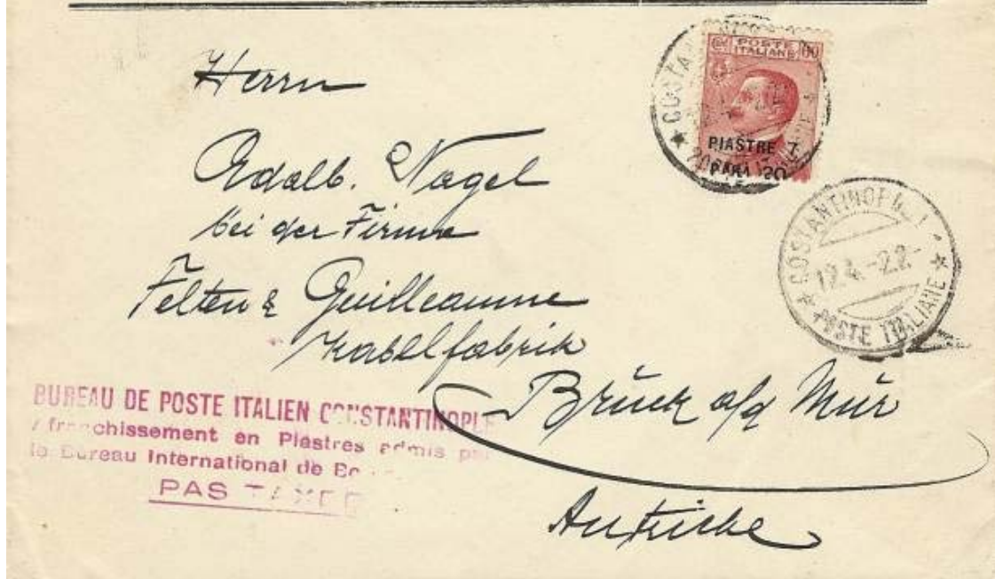
Lettre de Constantinople pour l'Autriche affranchie à 7 piastres 20.

تشیبہ کاؤ صنیعتیہ انجمنیہ درسمادت غلطہ اسکی کروک سوناق کورکچی باشی خان نومرو ۱۸-۱۹