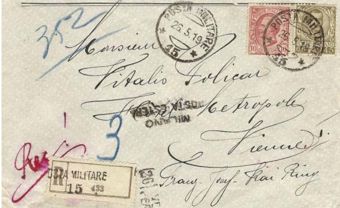
Lettre recommandée de Constantinople pour Vienne affranchie à 55 centesimi (25 centesimi de port + 30 centesimi de recommandation).

COMPTOIR OTTOMAN D'ENTREPRISES GÉNÉRALES COMMERCIALES & INDUSTRIELLES CONSTANTINOPLÉ