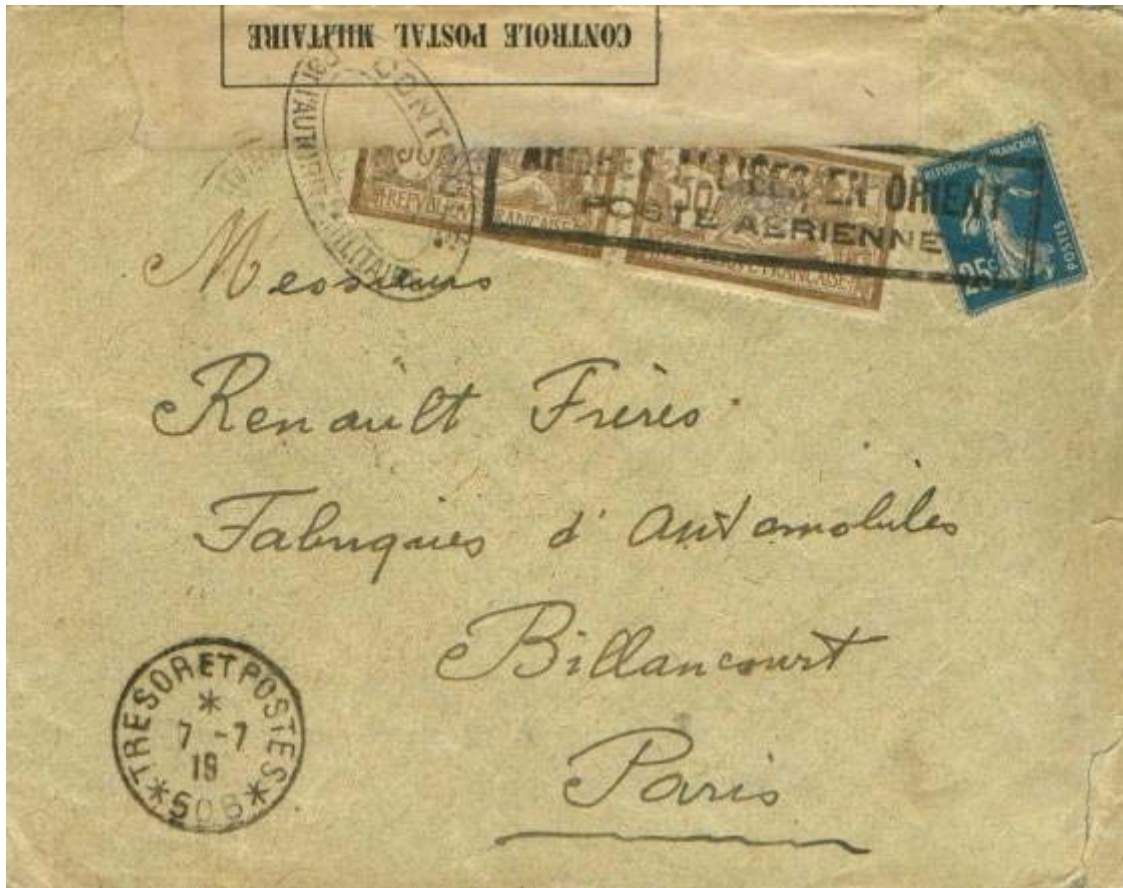
Lettre du 7 juillet 1919 de Constantinople pour Paris. L'affranchissement est de 1,25 francs (25 centimes de port + 1 franc de surtaxe arienne). Ce pli fait partie du 1 er vol.