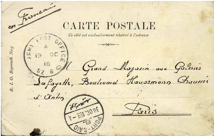
Carte postale commerciale de Beyrouth (SZ 8) pour Paris du 19 octobre 1918 censurée à Port-Saïd. Période d'acheminement gratuit.