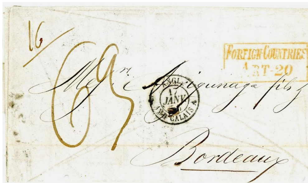
Figure 1. Lettre de Lima, pesant 16 g, acheminée via Londres où est appliquée le 16.1.1856 la marque Foreign Countries Art-20. Cette marque indique la provenance de la côte Pacifique, avec un taux de livraison de 5sh4p par once (16 décimes par 7,5 g) constant pendant toute la durée de la convention. Elle est mise en service en janvier 1856 en remplacement de Panama Transit mais est retirée très rapidement et n'a servi qu'à deux reprises, en janvier 1856. La France taxe à 21 décimes par 7,5 g, ici 63 décimes pour 3 ports.