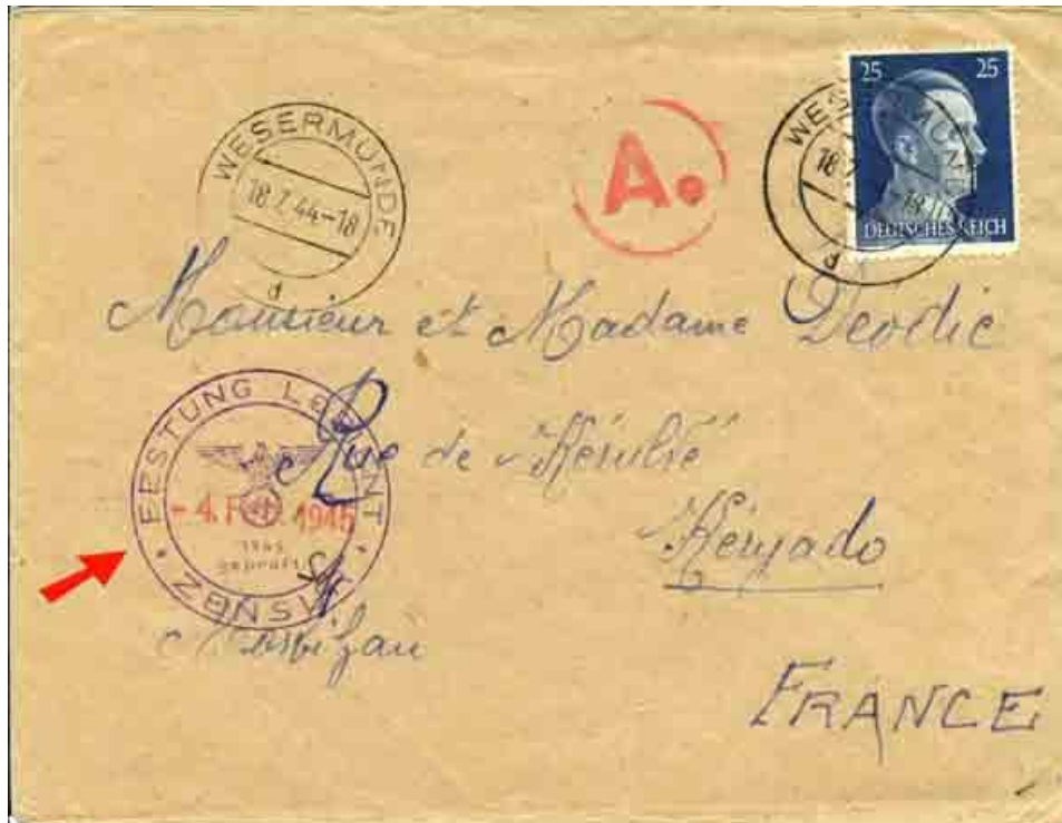
Lettre d'un Français requis du S.T.O., censurée au départ de Baggerlach et à l'arrivée dans la poche de Lorient. On notera que la lettre partie le 18 juillet 1944 est arrivée le 4 février 1945 !