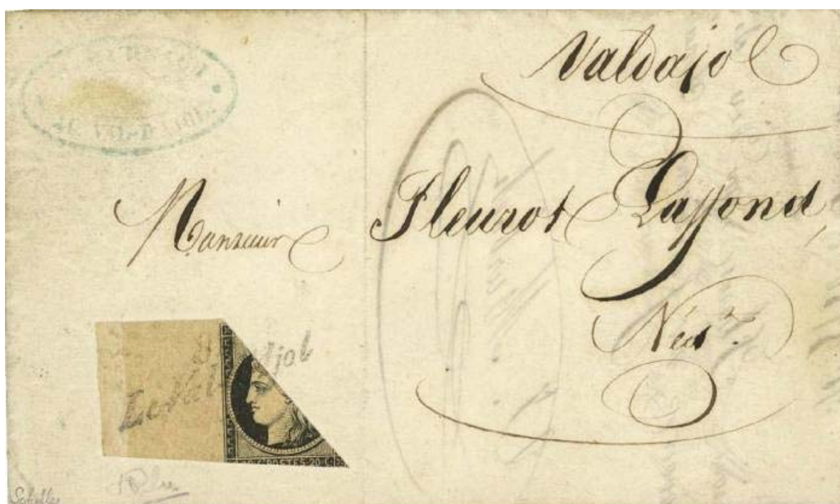
Lettre soumise à l'expertise

Le conférencier nous présente une lettre qui lui a été soumise à l'expertise il y a près de deux ans. Cette lettre était munie de deux certificats d'authenticité récents. Il nous détaille sa démarche pour corroborer son diagnostic qui contredit les deux certificats : recherche de documentation sur le bureau de poste, sur la cursive, d'images et de pièces de comparaison. Il nous explicite toutes ses investigations.