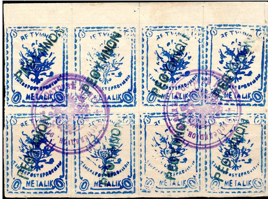
Bloc de huit avec oblitération linéaire de Réthymnon (ΡΕΘΥΜΝΟΝ).

Quatorze oblitérations linéaires sont créées pour quatorze villes et villages. Si l'oblitération Réthymnon (ΡΕΘΥΜΝΟΝ) est très commune, les oblitérations des treize autres bureaux sont rares, voire rarissimes.