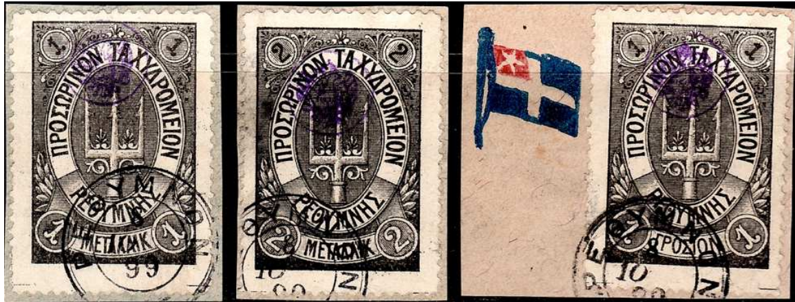
Les 3 valeurs du premier tirage de la deuxième émission avec oblitération circulaire de Réthymnon (ΡΕΘΥΜΝΟΝ).

Encore une fois, comme les Britanniques l'avaient fait quelques mois plus tôt, le gouverneur russe fait imprimer en lithographie une deuxième émission par la société Grundman & Stangel d'Athènes. Il existe deux tirages de cette deuxième émission, avec étoiles (six couleurs de trois valeurs chacune) et sans étoile (quatre couleurs de trois valeurs chacune) et la première date de mise en circulation est le 27 mai 1899. Mille exemplaires de chaque timbre du premier tirage a été imprimé et un peu moins de 50 000 timbres du second tirage ont été vendus (toutes valeurs confondues).