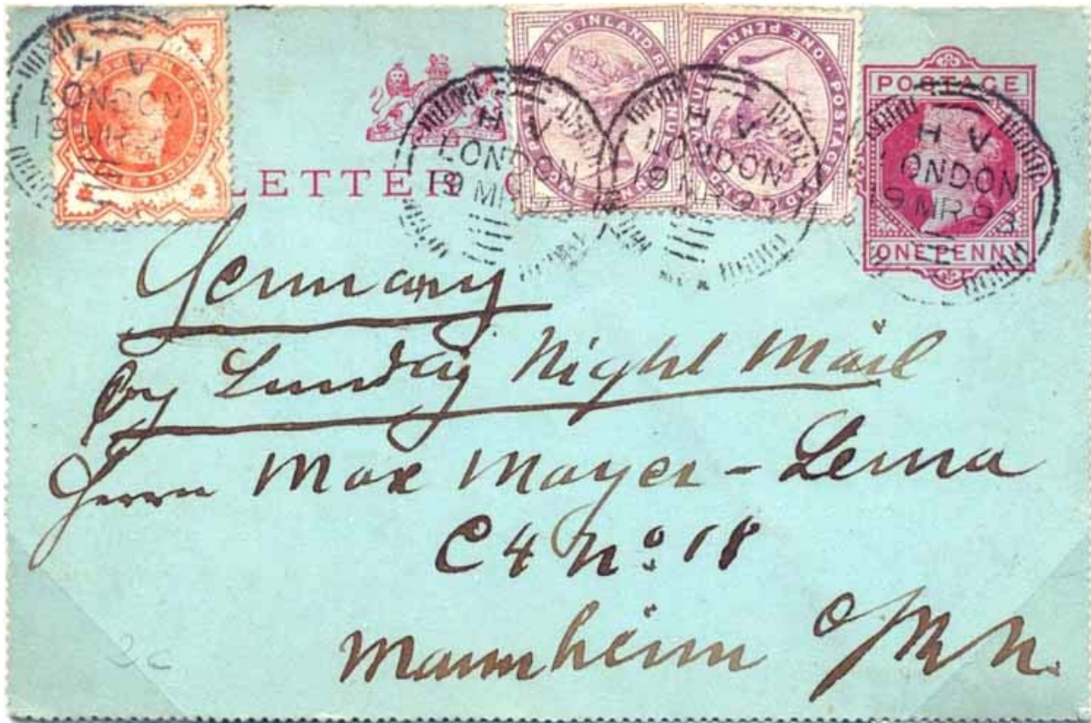
Usage exceptionnel à d'autres fins que la préoblitération : "Ailes de moulin" type A9 – code HV (bureau de Holborn Viaduc) du dimanche 19 mars 1893 pour Manheim par le courrier continental de nuit