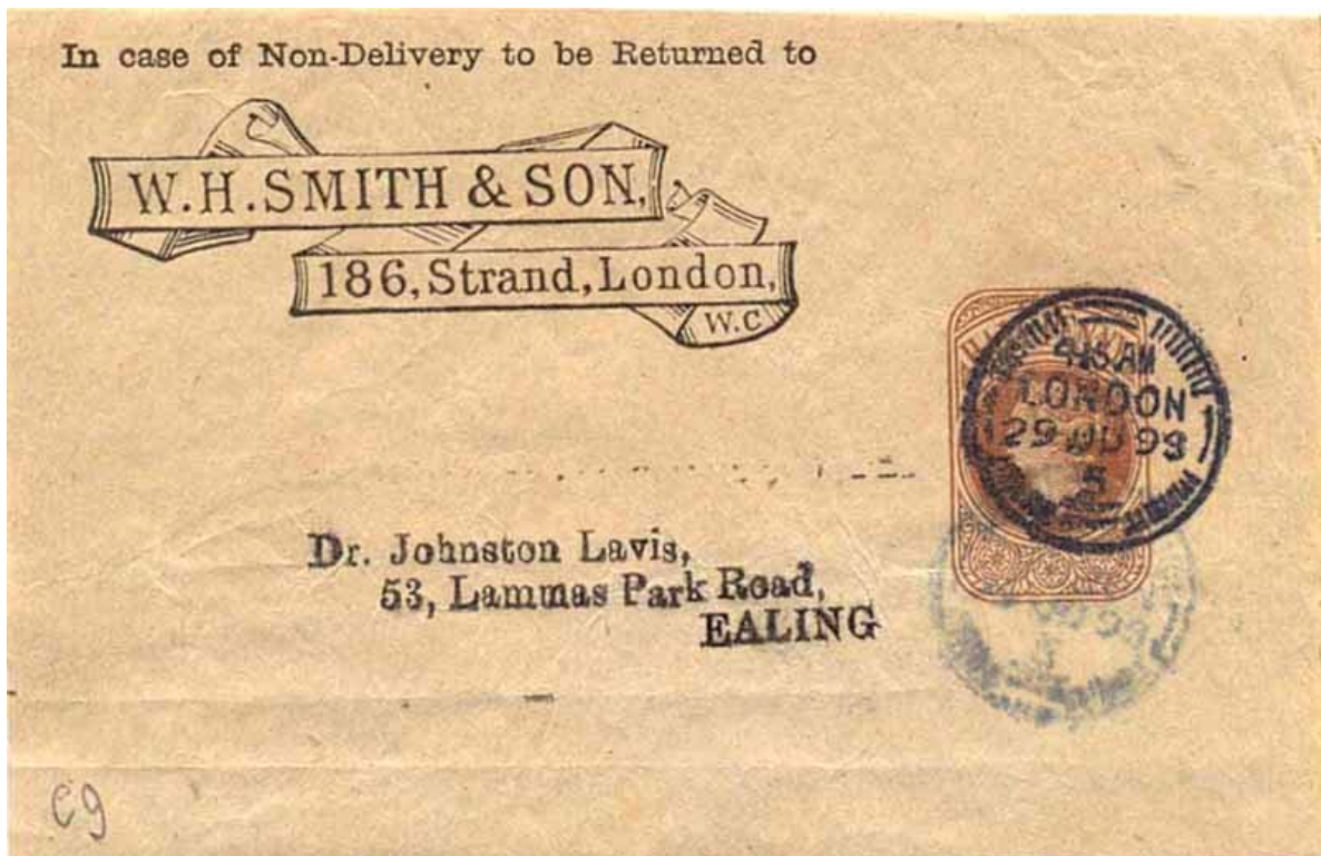
"Ailes de moulin" du type C9 avec impression "abklastsch" au verso de la bande pour journal, preuve du caractère préoblitérant du timbre à date