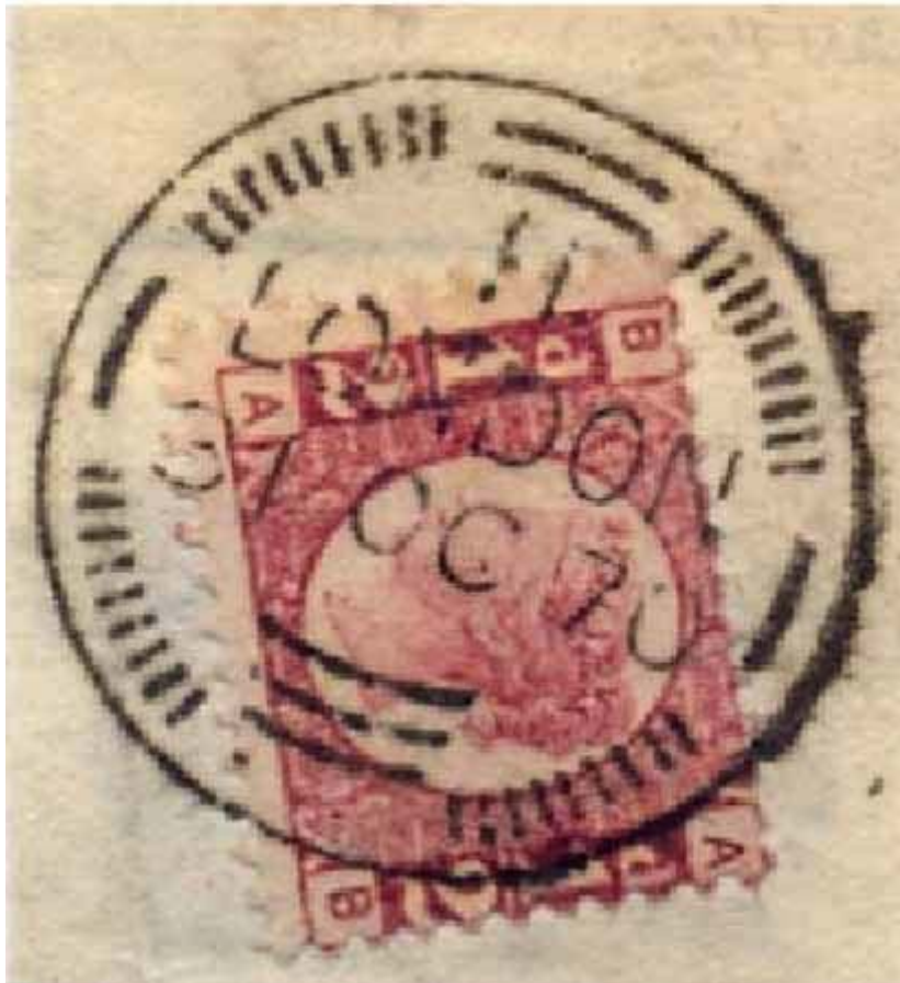
Première date connue à ce jour : timbre à date "Ailes de moulin" type A9 du 31 octobre 1870.