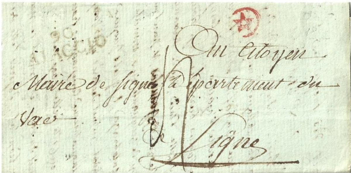
Lettre du 14 fructidor an VIII (1er septembre 1800) d'Ajaccio pour le Maire de Signes et retirée au bureau par le messenger communal.

Comme on ne la trouve que sur des lettres passées par la poste, il faut penser qu'elle a été apposée au bureau. Mais on ne connaît aucun texte sur la mise en service de cette marque d'arrivée.