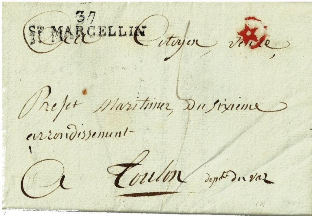
Lettre du 17 prairial an IX (6 juin 1801) de St Marcellin pour le préfet maritime de Toulon.

C'est difficile à croire car elle existe sur du courrier adressé au préfet maritime de Toulon, militaire le plus important du port.