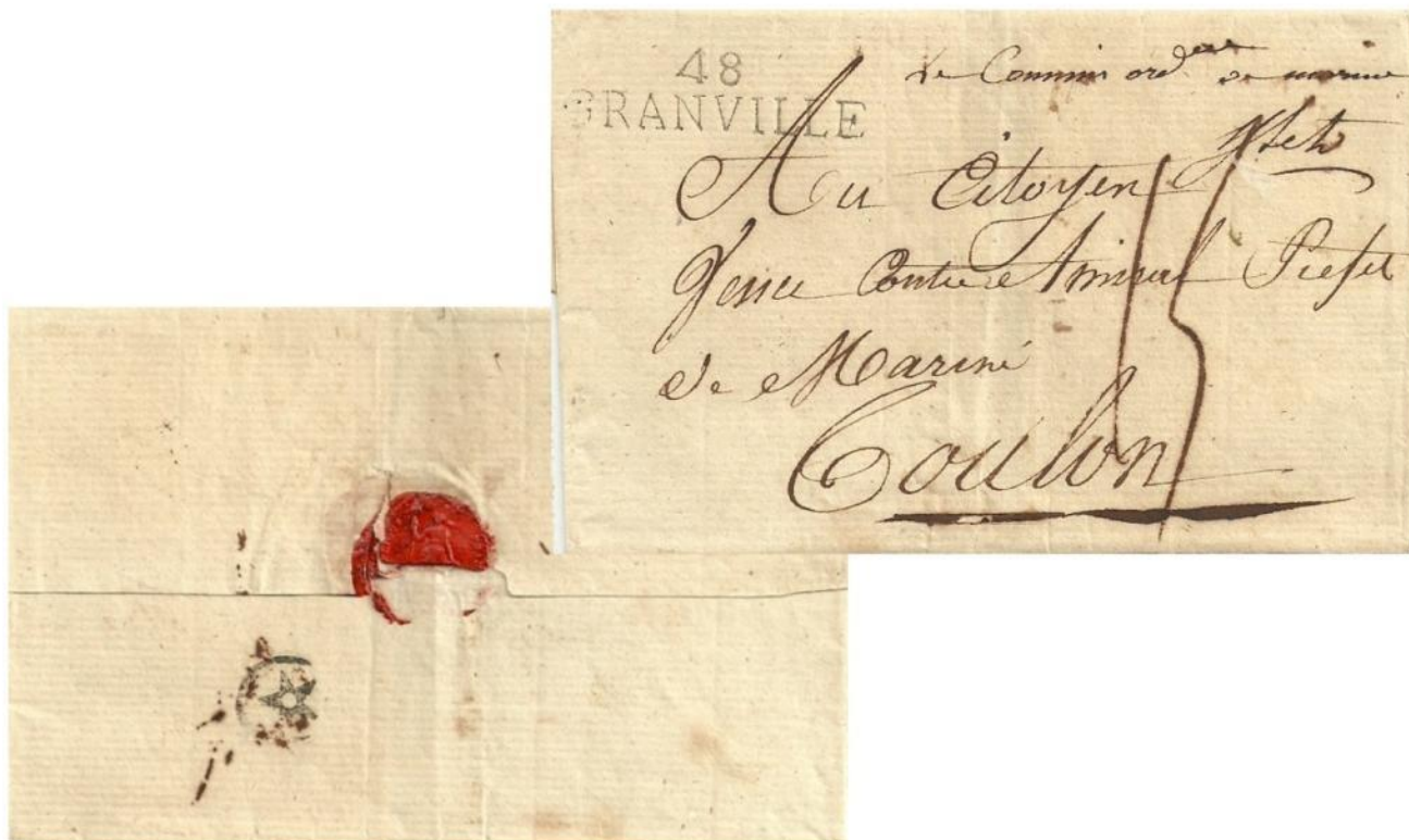
Lettre non datée de Granville pour le préfet maritime de Toulon avec la marque en noir au dos. Le contre-amiral Vence a été préfet maritime de Toulon du 20 juillet 1800 à mi-juillet 1802.