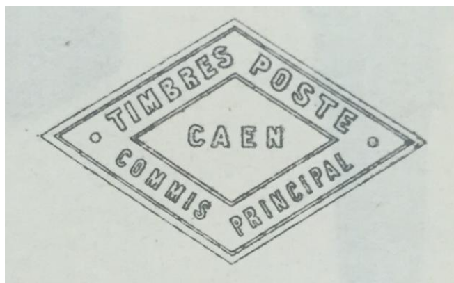
Instruction générale de 1936, Appendices 5, p 184.