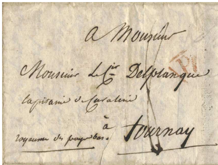
Lettre de Pajol de 1817 de Paris pour le royaume des Pays-Bas, illustrée par une vignette imprimée représentant le navire à vapeur L'Élise.

L'Élise devint ce jour-là le premier vapeur au monde à traverser une mer.