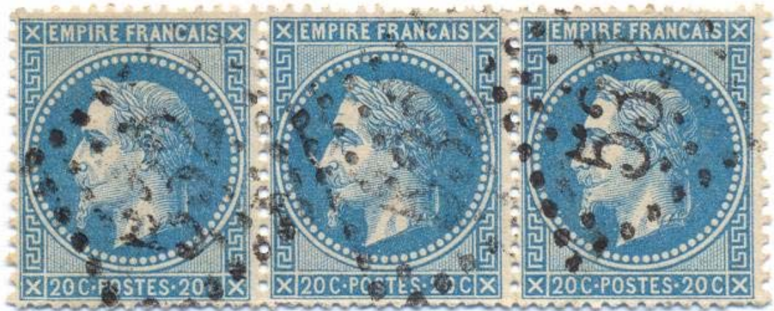
"La corne" au centre d'une bande de trois (cases 71 à 73)