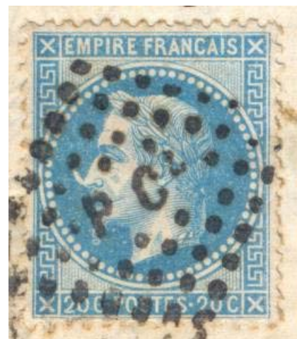
"La corne" sur une lettre de Rugles à Libourne passée par l'ambulant de nuit Cherbourg à Paris le 6 juillet 1870 (lettre et détail agrandi)

Elle est relativement courante et nos collègues de Fontaine et Fromageat avaient répertorié neuf états pour la case 72 du galvano.