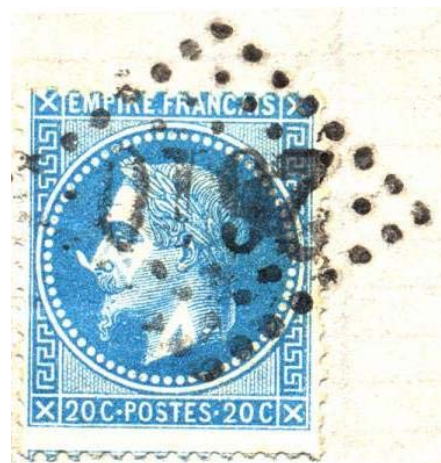
"La corne" sur une lettre du 7 septembre 1870 de Narbonne à Toulouse (lettre et détail agrandi)