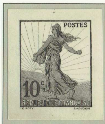
Dessin à l'encre de chine, Semeuse avec un corps ligné