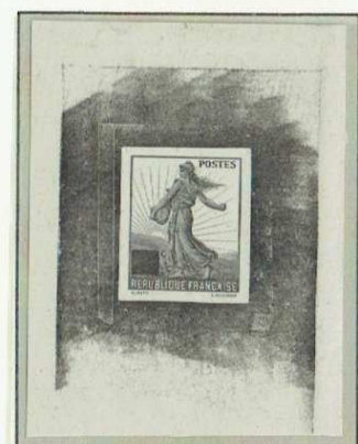
Epreuve d'état Sur papier blanc épais du poinçon en laiton gravé par MOUCHON