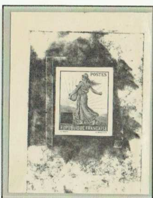
Epreuve d'état Sur bristol du poinçon en laiton gravé par MOUCHON