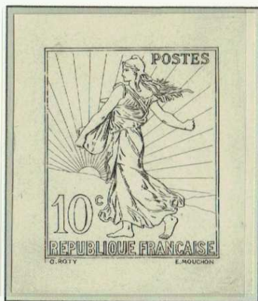
Dessin à l'encre de chine Semeuse avec un corps évidé

L'ensemble des Semeuses lignées fut modifié et retiré de la vente suite au changement de tarif du 16 avril 1906, et remplacé. Toutefois le 15 centimes semeuse camée vert, bien que figurant sur le bristol regroupant les semeuses camées, ne sera jamais émis.