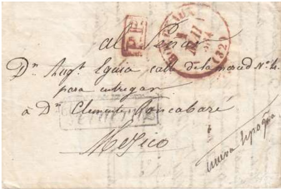
Voyage aller. Lettre de Bordeaux du 20 avril 1834, partie le 1er mai 1834 par le navire la petite Louise, date d'arrivée non connue.