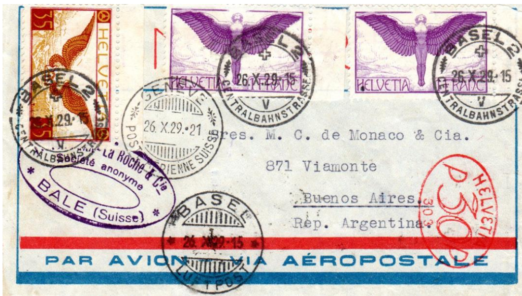
3. Enveloppe expédiée de BASEL le 26.X.39 pour BUENOS AIRES affranchie à 2,65 F (30 c de lettre simple + 2,35 F de surtaxe aérienne par 5 g selon le tarif du 01.08.1928). Cette enveloppe utilise successivement : 1) avion entre Bâle et Genève, 2) train entre Genève et Toulouse, 3) avion CGA Toulouse – Dakar, 4) bateau Dakar – Natal et enfin 5) avion entre Natal et Buenos Aires où elle arrive le 12.11.1929.