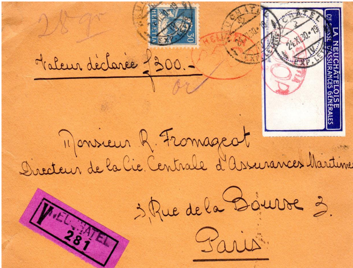
2. Enveloppe du 2e échelon de poids (28 gr) expédiée de Neuchâtel le 24.XI.1930 en France (30 c + 20 c), en recommandé (30 c) et avec valeur déclarée de 300 francs (or) (30 c / 300 francs). Machine HASLER (242).