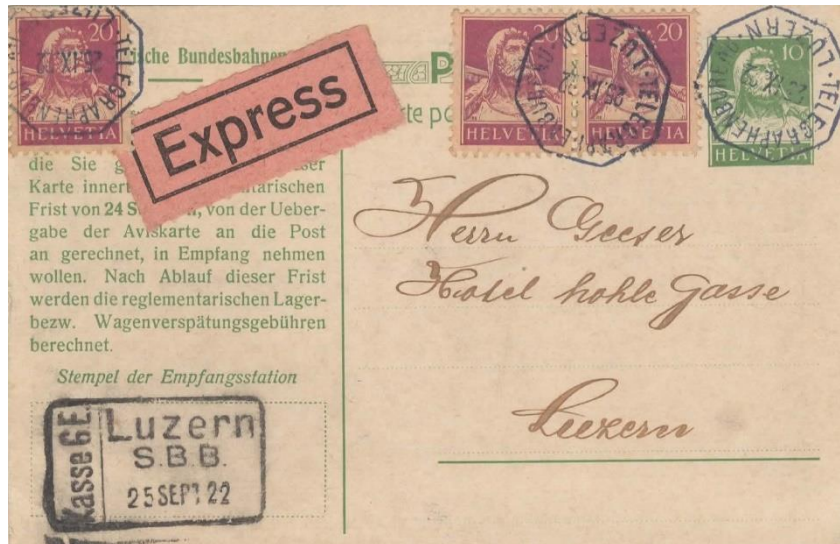
Carte postale de service à 10 c vert (langue allemande) expédiée par express le 25.IX.1922.

Ensuite sont présentés les entiers surchargés I.K.W. (surcharge mince et épaisse) et les entiers de service des PTT (groupe actuellement encore en construction à la suite de récentes découvertes).