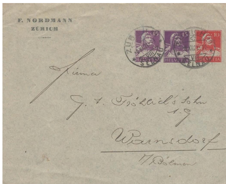
Enveloppe timbrée sur commande (F. Nordmann, Zürich) à trois empreintes (15 c + 15 c + 10 c) pour le tarif du 1 er février 1921 à 40 c d'une lettre du 1 er échelon de poids dans le régime international.

Les documents les plus rares sont les entiers postaux avec double et triple empreintes. Il n'existe pas d'entiers uniquement affranchis par quatre empreintes au type buste de Tell.