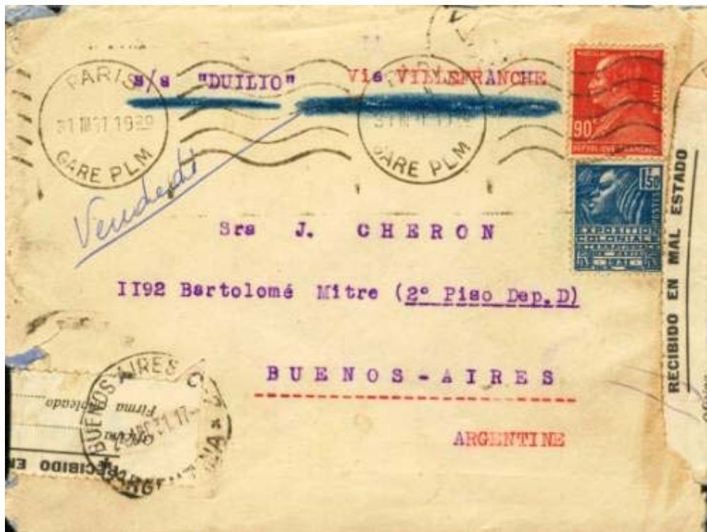
Lettre au 2 ème échelon affranchie à 2F.40 de Paris (31 mars 1931) pour Buenos-Ayres (18 avril) « Recibido en mal estado » (accident de service puis réparée - étiquette postale -) Routage « s/s « DUILIO » Via VILLEFRANCHE » paquebot de la Compagnie Italienne Costa assurant la ligne d'Amérique du Sud « Gênes – Buenos-Ayres – Villefranche – Barcelone ».