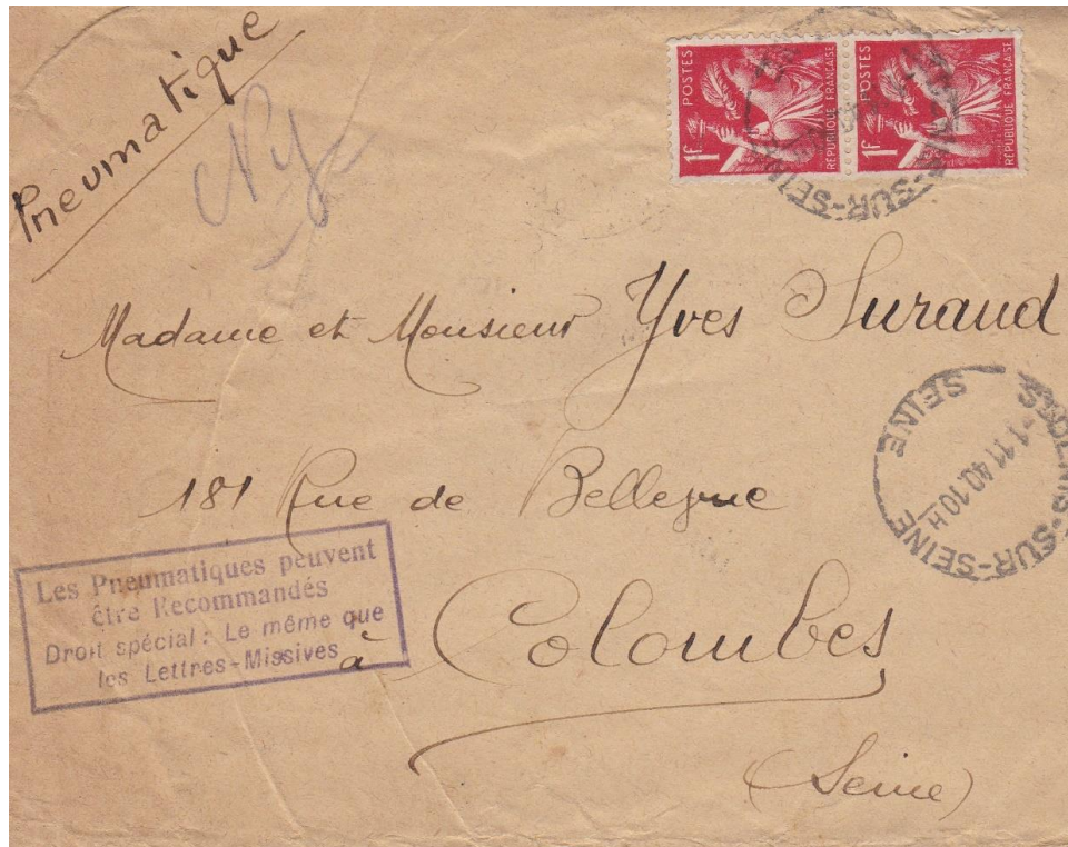
Fig. 4 – marque au « type 8 » de Saint-Denis-sur-Seine, le 1er novembre 1942.