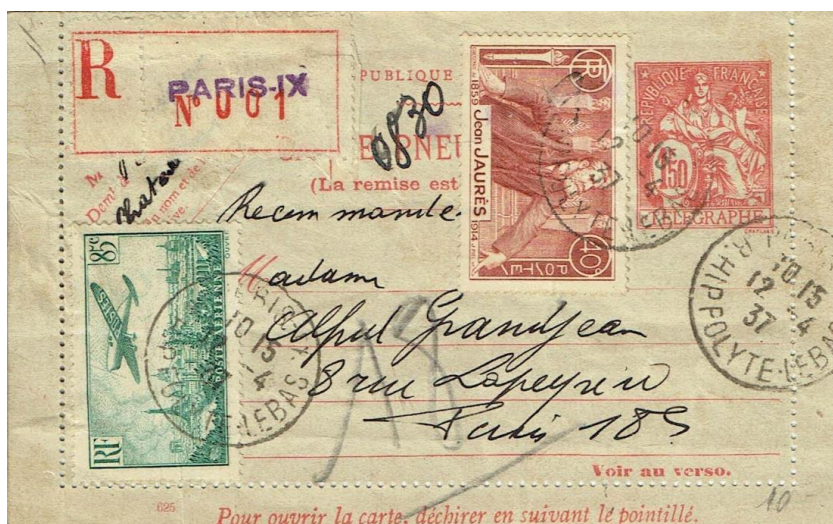
Figure 1 : pneumatique recommandé du 12 avril 1937, premier jour du service.

La possibilité de recommander les pneumatiques a été ouverte à partir du 12 avril 1937 (fig. 1) en application du décret du 26 mars de la même année. Les pneumatiques recommandés sont peu courants.