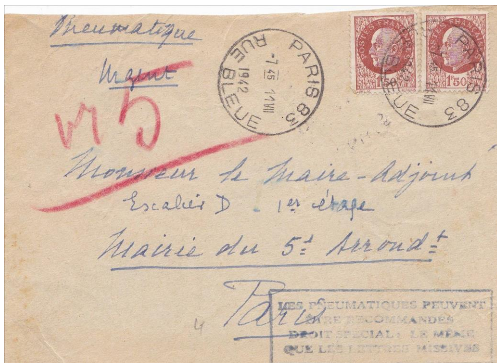
Fig. 5 – marque au « type 12 » de Paris 83, le 11 juillet 1942.

On ne connaît pas de marque après mars 1945. Sans le secours de textes, on peut imaginer que l'administration des Postes a considéré que le faible recours à la recommandation des pneumatiques ne justifiait pas l'entretien et le renouvellement du matériel nécessaire à cette promotion.