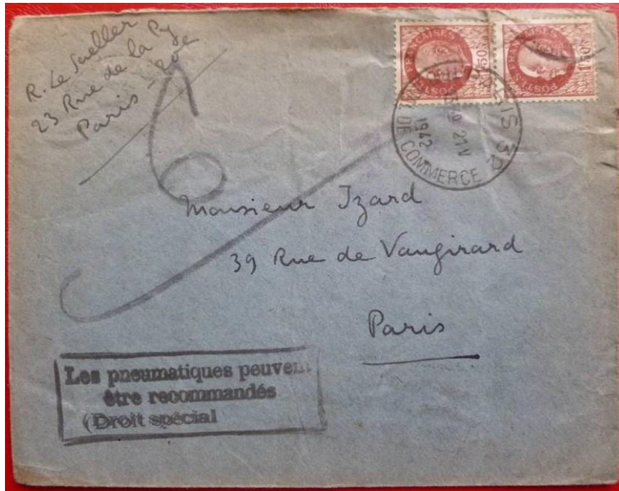
Figure 2 : marque au « type 1 » avec valeur grattée, à Paris 32 – le 21 mai 1942.

Trois types plus rares ne se distinguent de types courants que par la taille de la marque.