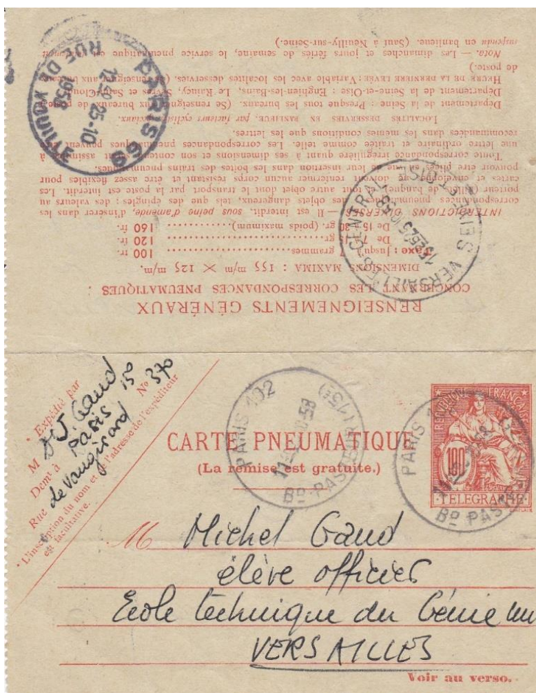
Carte pneumatique avec figurine à 100 f (tarif du 01/07/1957, 1er échelon 0 à 7 grammes), déposée le 25 octobre 1958 à Paris 102 pour Versailles. Timbres horodateurs au recto Paris 102 (11h20), au verso Paris 69 (12h40) et arrivée Versailles-Central (15h45).

C'est le 2 décembre 1957 que la poste pneumatique est étendue, par un circuit partant de Paris 69 et assuré par des préposés motocyclistes, à Meudon, Chaville, Viroflay, Versailles et le Chesnay (et à Rungis sur un autre circuit).