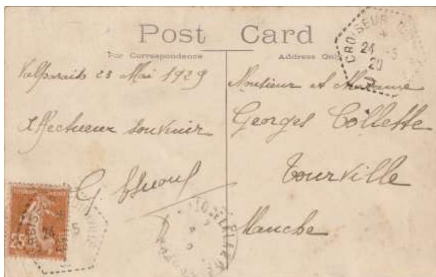
Figure 1 - Carte postale de Valparaiso avec oblitération hexagonale du Tourville en date du 24 mai 1929, et adressée à Tourville (-sur Sienne, dans la Manche). Cachet d'arrivée de Saint-Malo-de-la Lande (commune limitrophe).

Trois plis d'escale de Fort de France, de Valparaiso et Tahiti sont présentés.