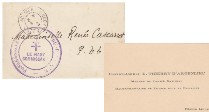
Carte de visite de l'amiral d'Argenlieu adressée en franchise postale à Nouméa.