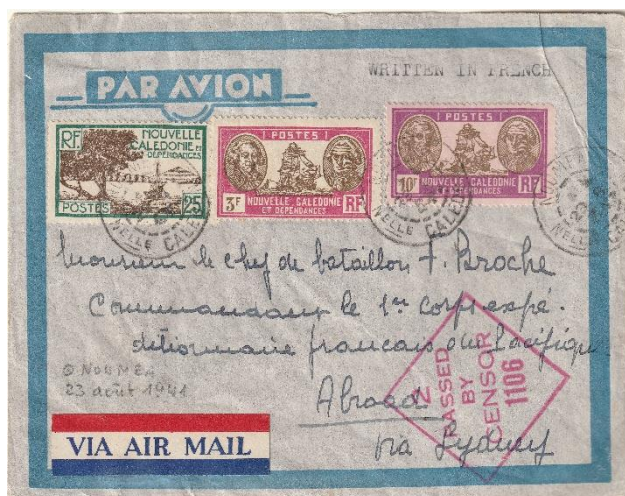
Lettre de Nouméa du 23 août 1941 adressée au capitaine Broche qui est alors stationné en Syrie.

Sur demande du général de Gaulle, le capitaine Félix Broche qui est alors à Tahiti, est envoyé à Nouméa pour reconstituer le Bataillon du Pacifique qui avait pris part à la Première Guerre mondiale. Le 5 mai 1941, commandés par le capitaine Broche, 300 jeunes volontaires Calédoniens avec 300 autres volontaires de Tahiti et des Nouvelles-Hébrides quittent Nouméa pour l'Australie puis le Proche-Orient. En juin 1942 le Bataillon s'illustre à Bir Hakeim où le lieutenant-colonel Broche est tué au cours des combats. Le Bataillon du Pacifique participe ensuite à la campagne d'Italie, au débarquement de Provence et combat jusqu'en Haute-Saône. Il rentre à Nouméa en mai 1946.