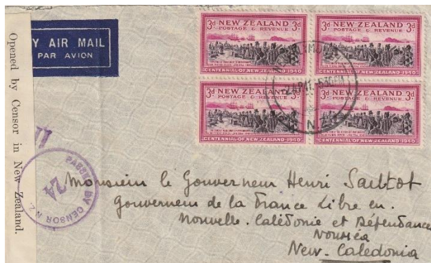
Lettre de Raymonde Jorre, une des deux premières calédoniennes engagées volontaires, adressée au gouverneur Sautot, depuis la Nouvelle-Zélande lors de son voyage vers Londres.