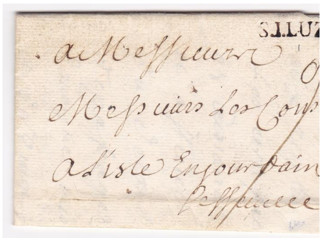
Saint-Jean-de-Luz – 22 avril 1719.

La première énigme concerne la très brève durée d'utilisation de deux marques de port dû au tampon de la ville de Saint-Jean-de-Luz en 1719 pour la première (trois lettres connues) et 1737-1739 pour la deuxième (cinq lettres connues). Une hypothèse avancée serait que l'administration veillait à une certaine clarté et homogénéité des marques de port dû réalisées par les bureaux. Les circulaires de cette époque sont malheureusement rares.