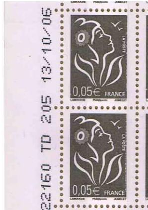
Figure 8. 0,05 € Marianne de Lamouche « Phil@poste » GEM avec

Si la GEM a un rendu plus grossier que la gravure traditionnelle, malgré les nets progrès actuels, et perd le relief voulu par l'artiste, la GGE, si elle restitue la netteté, ne retrouve pas le relief.