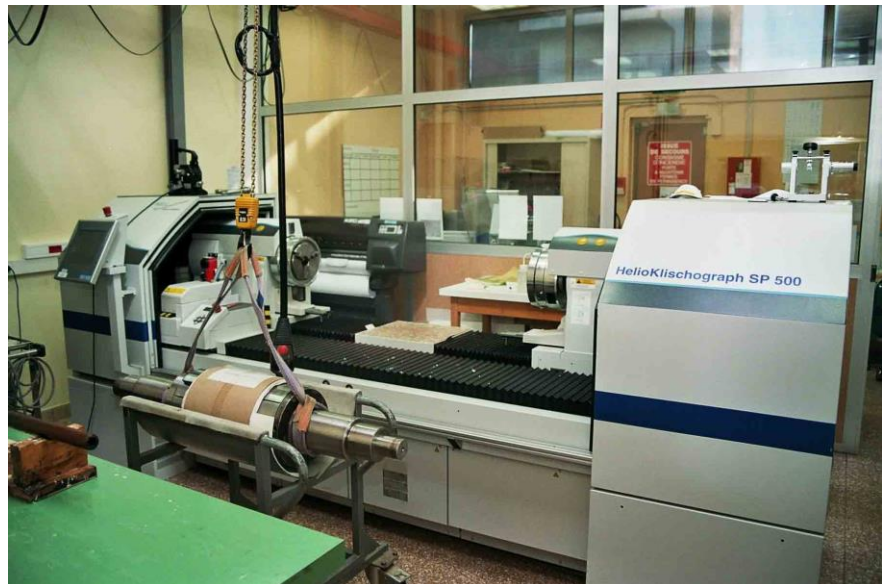
Figure 4. HELL SP 500 et un cylindre prêt au montage © Phil@poste.

Nous repartons du poinçon non cémenté, qui est encre et photographié. La photo est numérisée en un fichier. Un tour numérique, de marque OHIO en 1996 et aujourd'hui HELL SP 500, recopie cette image numérisée autant de fois que l'exige le « plan d'imposition prédéfini » par enfoncement du cylindre recouvert de cuivre, à l'aide d'une tête de diamant.