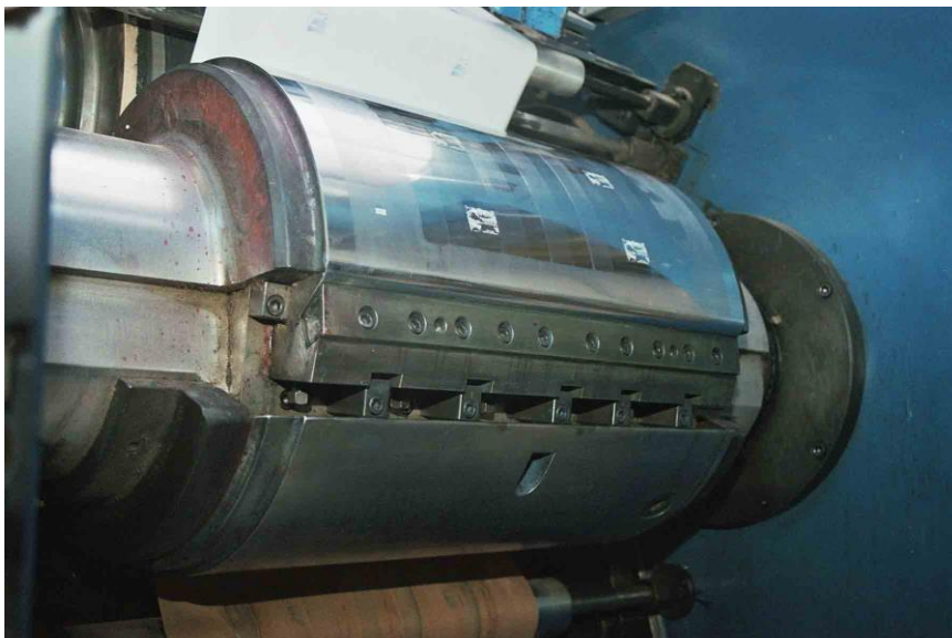
Figure 7. Virole de la presse Epikos sur laquelle la plaque est « pincée » © Phil@poste.

Par copie, la plaque de cuivre donne une plaque de nickel dont les timbres sont en creux et à l'envers. Elle est ensuite chromée.