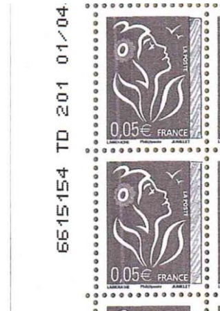
Figure 9. 0,05 € Marianne de Lamouche « Phil@poste » GGE avec une cocarde claire.