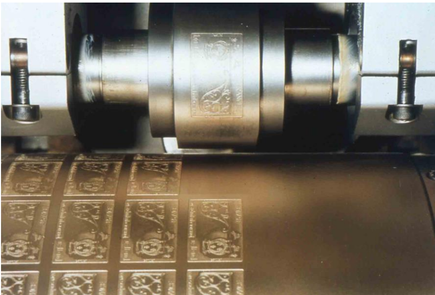
Figure 3. Transfert molette-cylindre du timbre « Journée du Timbre 1977 » © Phil@poste.

Après acceptation, le poinçon est cémenté. La gravure ne peut plus subir de modification. La gravure du poinçon, en creux et à l'envers, est transférée sur une molette cylindrique en acier doux sous pression de quatre à six tonnes pendant une heure. La gravure devient en relief et à l'endroit.