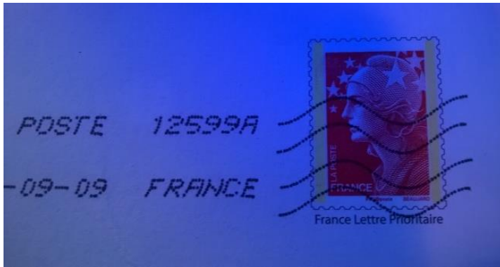
9. Timbre d'un PAP photographié sous UV.

Ces barres phosphorescentes imprimées en offset à plat sont au type F.