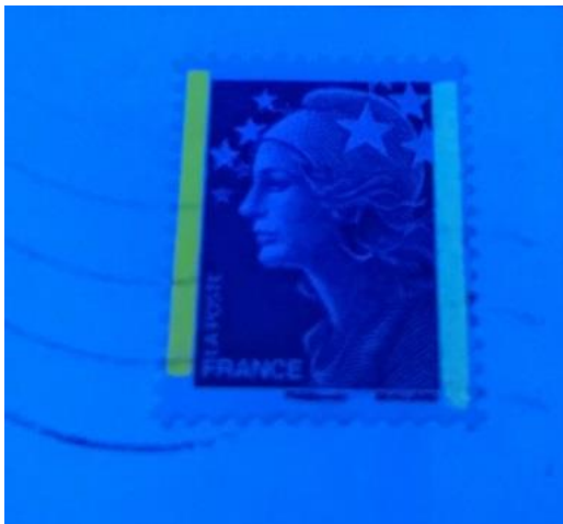
10. TVP bleu sur pli sous UV avec barres phosphorescentes E23 et F.

Très tardivement, en novembre 2013, il a été trouvé un pli « nature » affranchi avec un TVP bleu correspondant à cet aspect-là. Il reste le seul connu pour l'instant.