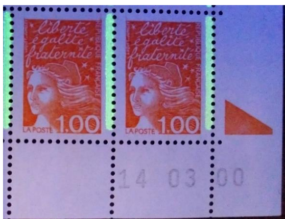
1 f Marianne de Luquet sous UV avec Pho type E23. Hauteur 23 mm et extrémités arrondies.