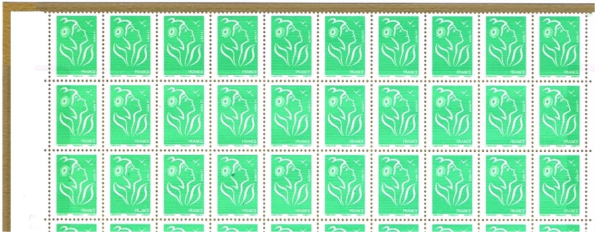
1er tirage du TVP vert Marianne de Lamouche Philaposte ***** Bord de feuille du 20 septembre 2006 sur TD6-7

Dernier tirage occasionnel : TVP rouge Marianne de Ciappa sans grammage ** Coin daté du 9 janvier 2018 sur TD201.