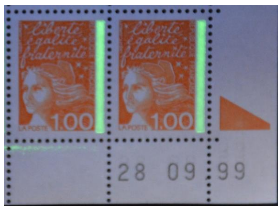
1 f Marianne de Luquet sous UV avec Pho type E22. Hauteur 22 mm et extrémités à angles droits.

Ces bandes Pho au type E22 caractérisent les différents aspects issus des tirages occasionnels.