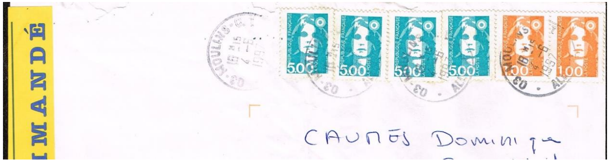
Pli recommandé avec 4 x 5 franc bleu-vert *****.