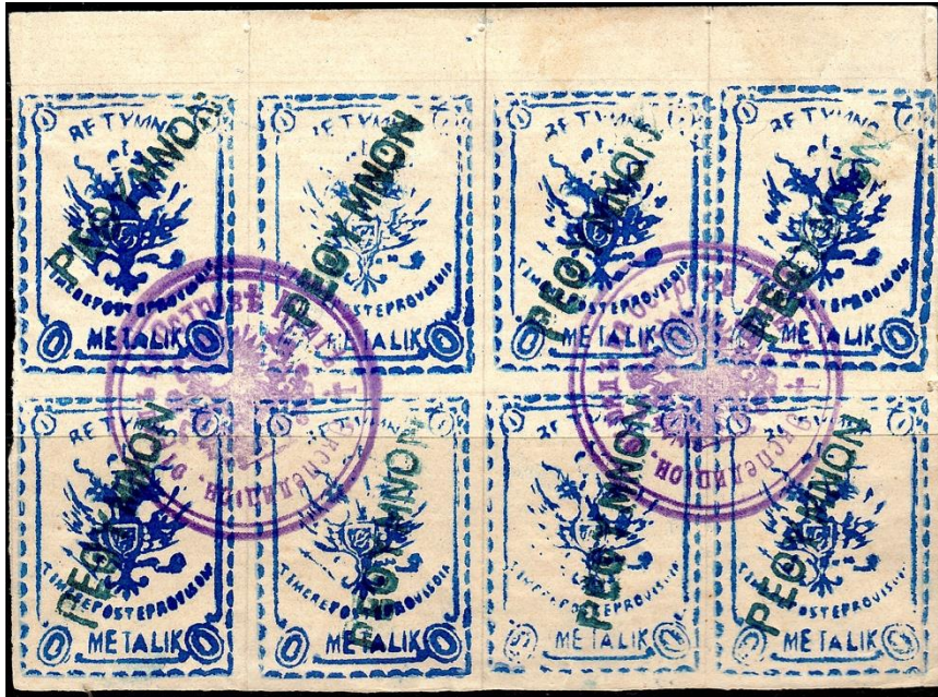
Bloc de huit avec oblitération linéaire de Réthymnon (PEΘYMNON).

Quatorze oblitérations linéaires sont créées pour quatorze villes et villages. Si l'oblitération Réthymnon (PEΘYMNON) est très commune, les oblitérations des treize autres bureaux sont rares, voire rarissimes.