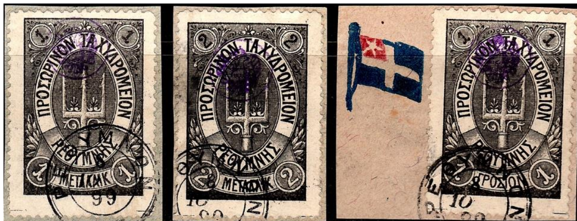
Les 3 valeurs du premier tirage de la deuxième émission avec oblitération circulaire de Réthymnon (ΡΕΘΥΜΝΟΝ).

Encore une fois, comme les Britanniques l'avaient fait quelques mois plus tôt, le gouverneur russe fait imprimer en lithographie une deuxième émission par la société Grundman & Stangel d'Athènes. Il existe deux tirages de cette deuxième émission, avec étoiles (six couleurs de trois valeurs chacune) et sans étoile (quatre couleurs de trois valeurs chacune) et la première date de mise en circulation est le 27 mai 1899. Mille exemplaires de chaque timbre du premier tirage a été imprimé et un peu moins de 50 000 timbres du second tirage ont été vendus (toutes valeurs confondues).