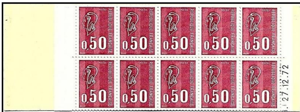
Figure 5 : Unique carnet imprimé le 27 décembre 1972 observé. (Collection Bernard Péroche)

Un dernier tirage le 27 décembre 1972 (fig. 5) avec des bandes phosphorescentes Pho A, également mis en vente, a été réalisé et se caractérise par l'absence de marques au verso.