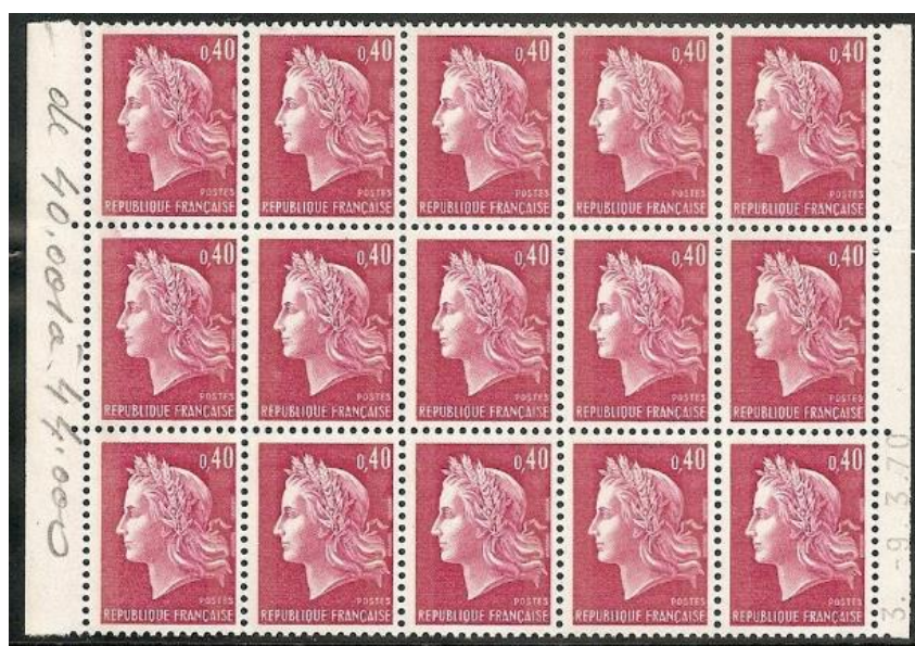
Figure 1 : 4000 feuilles imprimées (40001 à 44000) le 9 mars 1970 sur la presse TD6-3. (Collection Vincent MAILFER)

Le premier tirage connu, avec une surimpression des bandes phosphorescentes, en bobines gommées sans fin est réalisé sur la presse taille-douce n° 3 (TD6-3) dès le 9 mars 1970 (fig. 1).