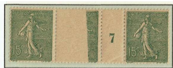
Bande de trois timbres au type 4, millésime 7 (pour 1917), dont un exemplaire avec la variété impression partielle.

S'il existe un poinçon du 15 centimes Semeuse camée, il n'a pas été réalisé de galvano d'impression pour cette valeur et l'on décide d'utiliser les galvanos des timbres-poste qui servaient en 1906 à savoir ceux avec les caractéristiques des timbres-poste au type 4.