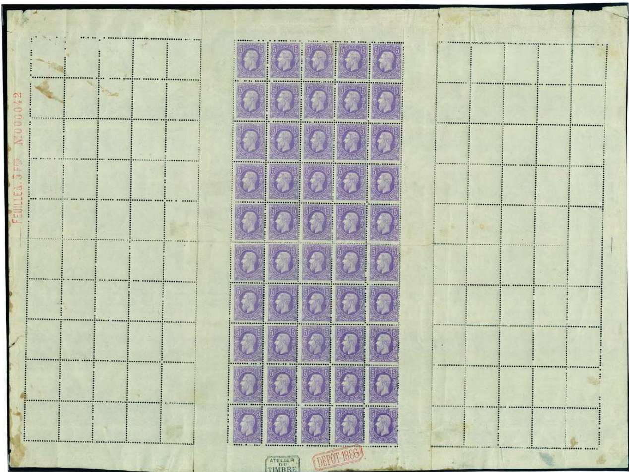
La feuille avec les deux panneaux vierges.