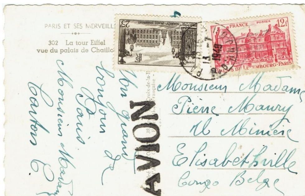
Carte postale du 13 juillet 1948 de Paris, timbre à date de Paris 123 (rue d'Anjou), pour Elisabethville, Congo Belge. Avec une grande griffe noire « AVION ». Affranchie à 37 francs, 12 francs pour les cartes postales pour l'étranger, tarif du 1er mai 1948 et 25 francs de surtaxe aérienne, tarif du 16 février 1948.