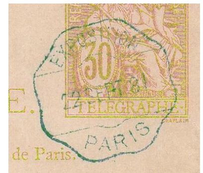
Utilisation du timbre à date le 22 septembre 1881 Exposition internationale d'électricité – du 11 août au 21 novembre 1881