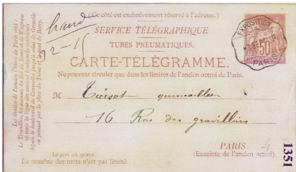
Utilisation du timbre à date le 3 septembre 1879 Exposition des sciences appliquées à l'industrie – juillet à novembre 1879