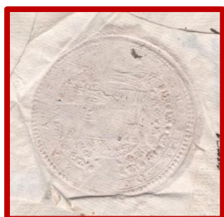
“Sello seco” (timbre à sec) avec les grandes armoiries du roi. C'est le roi qui signe la lettre

« Le Roi Vénérable Doyen et Conseil de l'église cathédrale de Cuenca. Ayant vérifié que la ville de Marseille est infectée par une maladie contagieuse, j'ai résolu que des prières publiques soient faites à Dieu, implorant la protection de la très Sainte Vierge Marie et de Saint Michel, Saint Sébastien et Saint Roch afin qu'ils demandent à afin qu'ils demandent à Dieu de libérer la France de ce grand malheur. Et donc je vous confie et je vous ordonne son accomplissement de la manière qui a été faite en d'autres occasions ; en attendant de votre amour et de votre zèle le plus grand service à Dieu et à moi, vous agirez cette fois avec l'affection que vous m'avez manifestée jusqu'à présent, et alors je serai bien servi. À San Lorenzo el Real, le 28 août 1720. Moi, le Roi »