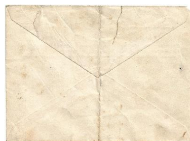
Figure 1. Lettre de Mahon pour Barcelone affranchie le 4 janvier 1939 (derniers jours de guerre). Indication « POR AVION ». Valeur des timbres, 95 centimes de peseta (45 + 50) 45 centimes pour l'affranchissement d'une fraction de 25 grammes pour l'intérieur de la zone républicaine (tarif du 1er avril 1937 (2)) et 50 centimes de surtaxe aérienne. Aucune marque au verso.

Malgré son apparence, cette lettre a été expédiée par une voie française. Après son examen, voici quelques conclusions :