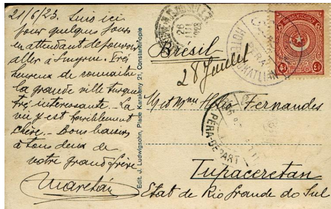
Carte postale du 21 juin 1923 à destination de Tupaceretan au Brésil affranchie à 4 piastres \frac{1}{2} (tarif UPU). Elle transite par le bureau de Péra pour arriver à destination le 26 juillet. Le timbre est oblitéré par le cachet de l'hôtel Tokatlian.