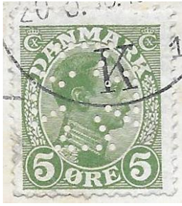
Perforation croix de Malte du timbre-poste danois